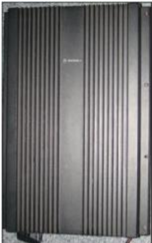
Motorola CQF Repeater

Den 22 november driftsattes den nya SK2RIU repeatern för 70 cm i Vännäs.