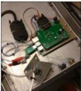
Raspberry Pi och Interface för SVXlink

Repeatersändaren sänder även en subton på 107.2 Hz. Har man subtonsquelchen aktiverad så slipper man lyssna på störningar som är vanliga i urban miljö. Mottagaren öppnar då endast när repeatersändaren är igång.