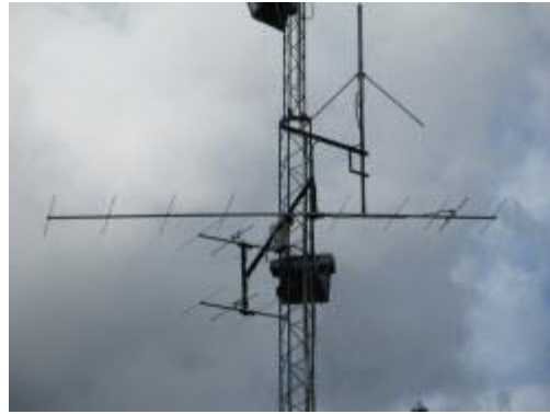
Fyrens antenner 10 el och 2 x 4 el