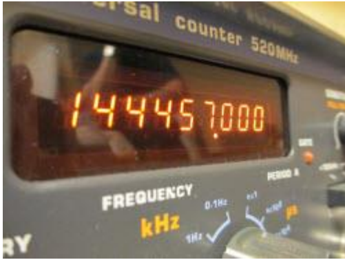
SK2VHF frekvens 145.457000 MHz