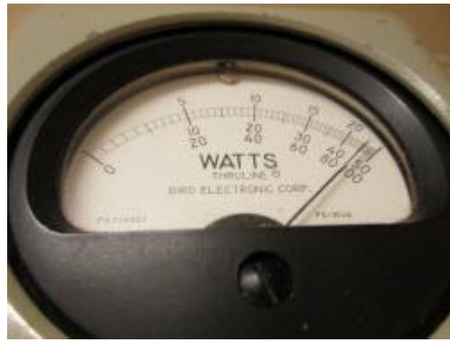
Tom SM2DJK ser bekymrad ut över fyren. Slutsteget utbytt mot reservslutsteget 95W ut